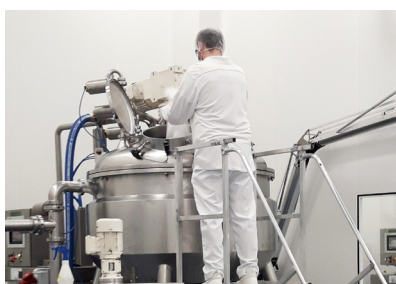
Traitement d'air et dépeussierage d'un nouvel atelier de cosmétique blanche