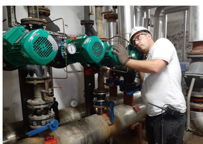
Désembouage du réseau hydraulique d'un lycée rhônalpin