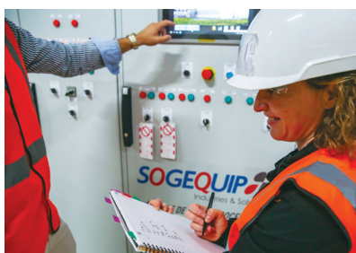
De la conception à l'exploitation de la production des utilités